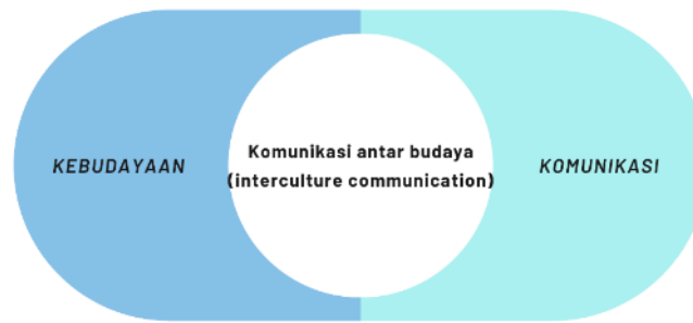
Gambar 1. Diagram Teori Interkultural dalam Gatra-Gatra Komunikasi Antar Budaya

Selain itu, interaksi antara musisi dari latar belakang budaya yang berbeda juga menjadi bagian integral dari fenomena ini. Dalam banyak pertunjukan talempong orgen , musisi yang berasal dari berbagai daerah dan latar belakang budaya berkumpul untuk berkolaborasi. Proses ini tidak hanya memperkaya pengalaman musikal, tetapi juga menciptakan ruang untuk dialog antarbudaya. Nursilah dkk. (2024) menjelaskan bahwa seniman saling belajar dan berbagi pengetahuan tentang teknik bermain, repertoar, dan tradisi musik masing-masing, yang pada gilirannya memperkuat rasa saling menghargai dan memahami antarbudaya. Hal ini menciptakan lingkungan yang inklusif, di mana perbedaan dihargai dan dijadikan sebagai sumber kekuatan dalam menciptakan karya seni.