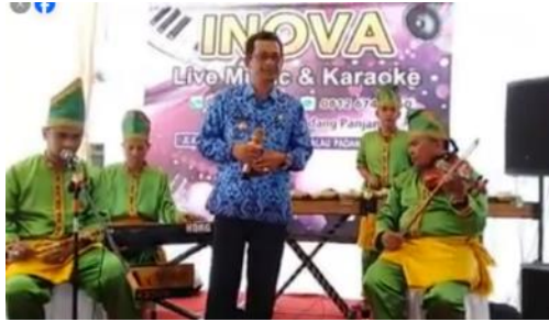
Gambar 5. Talempong Organ Inova Musik

Perbedaan signifikan antara talempong goyang dan talempong organ terletak pada peran instrumen keyboard yang ada dalam talempong organ . Dalam talempong organ , alat musik drum, bass, dan gitar elektrik dikemas dalam satu instrumen, yaitu keyboard . Talempong berfungsi sebagai ritme chord dan melodi, sedangkan untuk memperkaya dan memperindah melodi talempong organ , dihadirkan perpaduan instrumen tiup tradisional ( bansi , saluang , dan alat musik tiup tradisional lainnya) serta alat musik barat seperti saxophone atau biola. Bentuk pertunjukan talempong organ oleh Inova Musik mendapatkan respon yang sangat baik dari masyarakat Padang Panjang. Bahkan, pada tahun pertama kelahiran talempong organ Inova Musik, grup ini sudah diundang untuk mengisi acara hiburan baralek dan perayaan hari besar di Kota Padang Panjang, bahkan di luar Kota Padang Panjang.