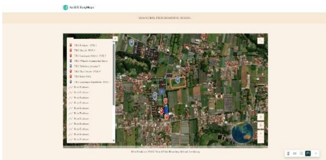
Gambar 3. Tampilan Peta Gamifikasi pada Earthhero-Z

Untuk memetakan potensi risiko bencana di lingkungan SMA Nurul Fikri Boarding School Lembang, diperlukan beberapa data yang terhubung dengan koordinat geografis dari setiap lokasi yang berpotensi terkena dampak bencana. Data persebaran ini meliputi berbagai objek alam dan fasilitas yang berada di sekitar area sekolah, yang dapat memberikan wawasan mengenai potensi ancaman bencana. Beberapa lokasi yang termasuk dalam pemetaan ini antara lain Area Masjid, Area Thalibah 1, Area Thalibah 2, Area gedung sekolah, Lapangan olahraga, kantin dan Resto, dan area lainnya. Data-data ini diolah menggunakan Google My Maps untuk menghasilkan peta yang lebih jelas dan informatif, yang memudahkan dalam mengidentifikasi risiko bencana serta merencanakan langkah-langkah mitigasi yang lebih efektif di sekitar SMA Nurul Fikri Boarding School Lembang.