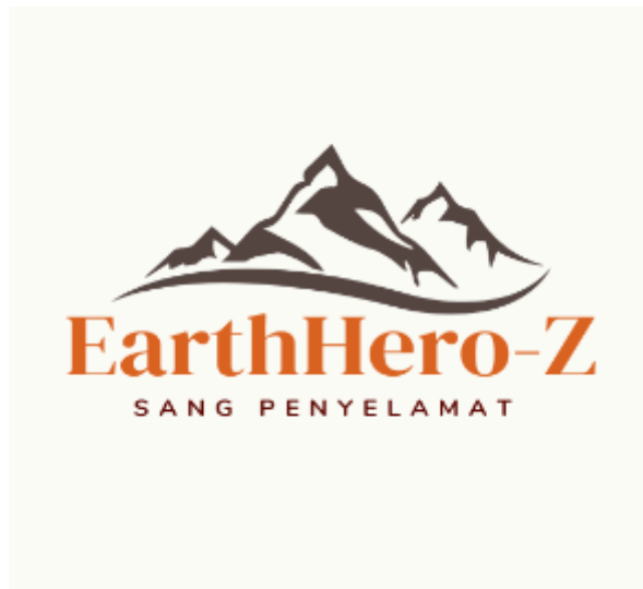
Gambar 1. Logo Earthhero-Z

Perkembangan teknologi digital telah membawa perubahan signifikan dalam berbagai bidang, termasuk dalam pembelajaran geografi. Geografi berbasis digital memanfaatkan teknologi informasi dan komunikasi untuk meningkatkan produktivitas pembelajaran, terutama dalam memahami topik kebencanaan. Hal ini mendorong siswa untuk memvisualisasikan data geospasial, memahami pola penyebaran risiko, dan mengembangkan keterampilan berpikir kritis dalam menganalisis potensi bencana di lingkungan sekitarnya. Salah satu teknologi yang mendukung pendekatan ini adalah Sistem Informasi Geografis (SIG), yang mewujudkan representasi spasial dari berbagai data kebencanaan secara interaktif.